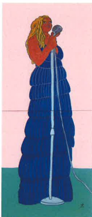
「女性ジャズシンガー」90×40