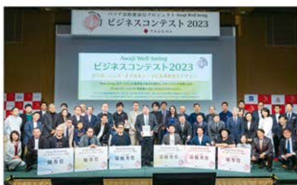
ファイナリストによるピッチコンテストを実施、優秀賞・最優秀賞を決定。

淡路島を舞台に、「Well-being」をテーマにした新産業の創出を目的に、スタートアップによるピッチイベントや、有識者によるパネルディスカッションを実施。