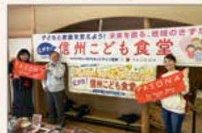
〈長野〉子ども食堂ボランティア