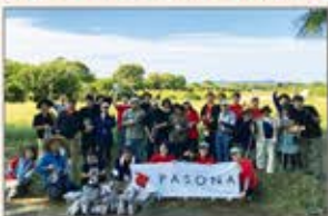
〈浜松〉視覚障害者の方との芋ほり