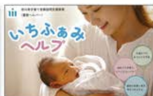
市川市子育て世帯訪問支援事業など、自治体から子育て支援事業を受託