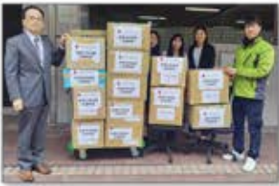
避難所 緊急物資支援

日本有数の伝統工芸が根付く当該地域の工芸職人・作家を支援し、これまで受け継がれてきた文化を守り、未来に継承するプロジェクト。被害を受けた職人・作家の方の制作活動の再開・継続支援(金銭的支援、買取支援、仕事の発注等)を実施。2024年7月にはパソナグループと石川県が伝統工芸を支援する連携協定を締結。