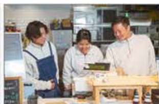
淡路島 飲食スタッフ向けサステナビリティ研修