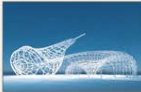
“いのちの象徴”アンモナイト

“自然とテクノロジーの調和”という私たちの想いを「NATUREVERSE」に込めました。“いのちの象徴”である心臓を作り上げるiPS心筋シートなど、最新のテクノロジーの展示をはじめ、身体と心、そして社会的な健康を実現する Well-beingな社会を目指し、誰もが心豊かにイキイキと活躍する真に豊かな社会のあり方を世界に向けて発信します。