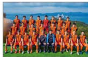
FC AWJサッカーチームで9名が競技と仕事のハイブリッドキャリアを実践。