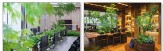
総合電機メーカー 総務オフィス