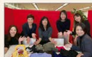
〈名古屋〉生活用品の寄贈