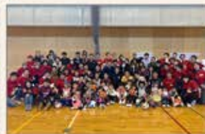
〈大阪〉デフサッカー教室