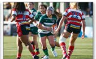
英国でプロラグビーチームに挑戦しながら、現地で「スポーツ選手の夢キャリア教室」などの活動も実施。