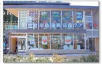
復興応援フェア 石川県物産展