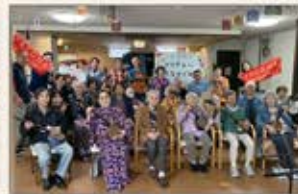
〈兵庫〉デイサービス施設三線イベント