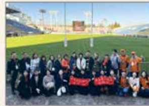
〈東京〉ラグビー試合運営ボランティア