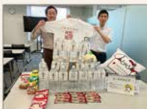
〈札幌〉パナソニック・札幌