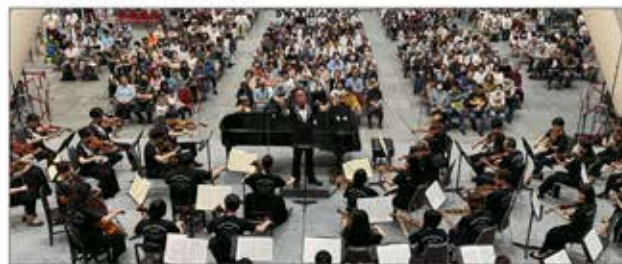
世界的なクラシックの祭典に選出され、演奏を披露