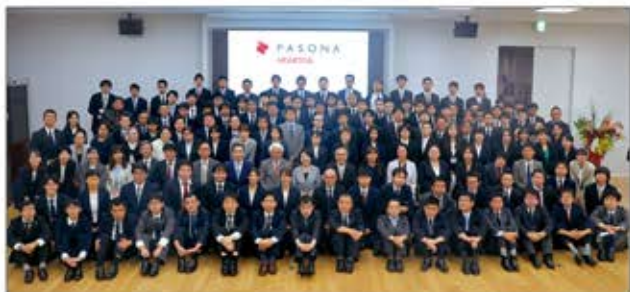
パソナハートフル2024年度 事業方針会議

「障害は個性、才能に障害はない」をコンセプトに、働く意欲がありながら就労が困難な障害のある方々がイキイキと働ける環境と、健常者と共に社会参加できる“共生の場”を創りだしてきました。特例子会社パソナハートフルをはじめ、グループ各社で個々の能力を活かして活躍の場を広げています。