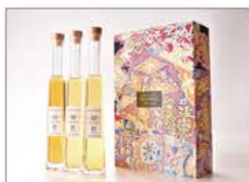
ブレンド古酒「INISHIE 匠」ギフトボックスデザイン