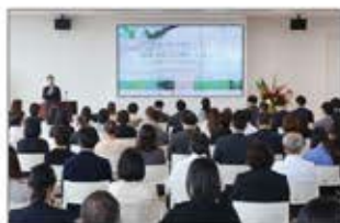
全社員向け環境基本研修