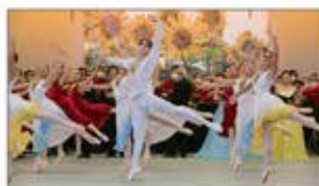
ウクライナ支援の取り組みから誕生した「Awaji World Ballet」