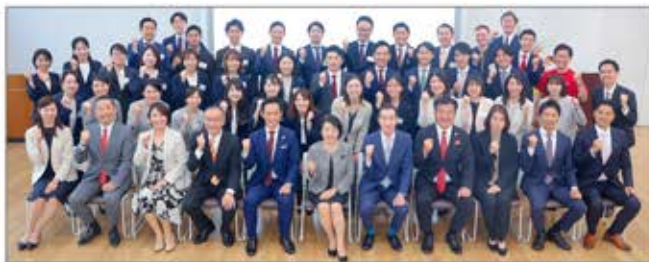
社会貢献活動のリーダーとして、全国のグループ各社より40名の社会貢献委員を任命