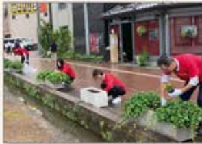
〈金沢〉駅前通り花壇整備活動