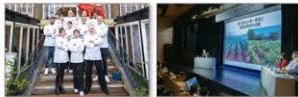
【後援】 公益財団法人2025年日本国際博覧会協会 / 農林水産省 / 文部科学省 / 在大阪イタリア総領事館 / 兵庫県 / 兵庫県商工会連合会 / 淡路市 / 洲本市 / 南あわじ市 / 兵庫県教育委員会 / 淡路市教育委員会 / 洲本市教育委員会 / 南あわじ市教育委員会 / 淡路市商工会 / 洲本商工会議所 / 南あわじ市商工会 / 五色町商工会 / 淡路島ユネスコ協会

●ワールドシェフ王料理大会 ●ワールド食育フォーラム 国内外から集った一流シェフ 様々な角度から「健康的な食の在り方」について学ぶ機会を料理で競う。 創出。