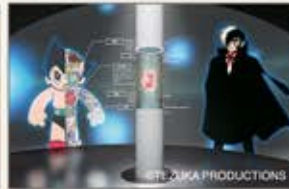
世界に向けて「iPS心臓」が動き出す