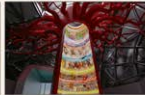
生命の進化のダイナミクスを表現した「生命進化の樹」