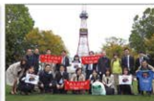
札幌大通り公園清掃活動