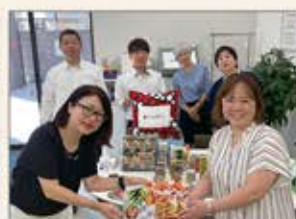
〈宮崎〉パナソニック・宮崎