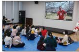
障害児向け春のお花見会

医療的ケアの必要な子供とそのご家族に外出の不安なく1日過ごしていただくために、淡路島のシアターレストラン「HELLO KITTY SHOW BOX」への遠足を企画。