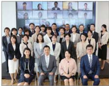
第2期 ワークライフファシリテーター認定式