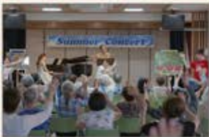
〈東京〉敬老館サマーコンサート