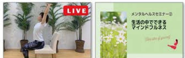
健康経営度調査票に即した多様なテーマを提供