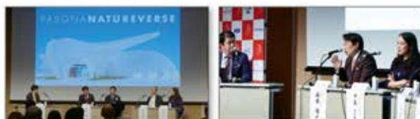
【後援】 神戸商工会議所 / 大阪商工会議所 / 京都商工会議所 / 兵庫県 / 淡路市 / 淡路市商工会 / 神戸市 / 大阪イノベーションハブ / ひょうご神戸スタートアップ / エコシステムコンソーシアム / Japan Society of Northern California / ANCHOR KOBE / バイオコミュニティ関西 / 一般社団法人 日本バイオデザイン学会 / 公益財団法人2025日本国際博覧会協会