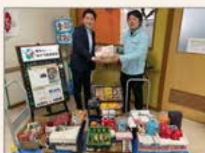
〈淡路島〉BPOセンター及び飲食店舗