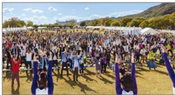
【後援】 淡路市 / 淡路市教育委員会 / 淡路市商工会 / 洲本市 / 洲本市教育委員会 / 洲本商工会議所 / 五色町商工会 / 南あわじ市 / 南あわじ市教育委員会 / 南あわじ市商工会 / 一般財団法人淡路島くらしみ協会 / 淡路島観光協会 / 兵庫県 / 兵庫県教育委員会 / 兵庫県商工会連合会 / 公益財団法人兵庫県スポーツ協会 / スポーツ庁 / 公益財団法人2025年日本国際博覧会協会

あらゆる人々が健康であり続ける社会の実現に向け、自然豊かな淡路島で大人から子供まで誰もが楽しめる大運動会を開催。