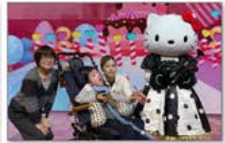
HELLO KITTY SHOW BOXへの遠足