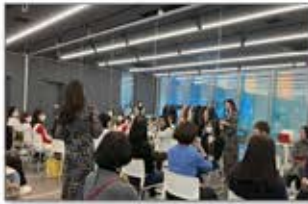
東京 ママ向けキャリア教室

ひとり親家庭間のコミュニティづくりや親子の絆を深める機会の創出を目的に親子サッカー教室やダンス教室などを開催。