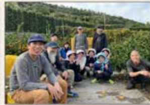
〈松山〉みかん収穫ボランティア