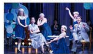
劇場「波乗亭」ミュージカル公演