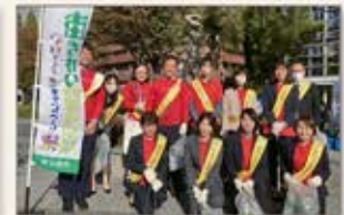
〈広島〉平和大通り清掃活動