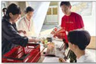
被災地ボランティア活動