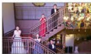
島内のレストランでのオペライベント

淡路島における地方創生の取り組みとして、音楽・アート・エンターテインメントなど多岐にわたる分野で活動を展開。詳しくはP19ページ「アート&カルチャー/エンターテインメント」をご覧ください。