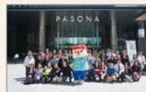
〈東京〉オフィス周辺清掃活動