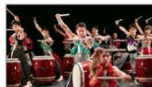
淡路島に集まった若者が結成した和太鼓集団「鼓淡」