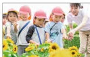
社員・スタッフが子育てしながら働ける「パソナファミリー保育園」