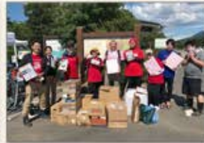
〈福岡〉久留米市豪雨災害ボランティア