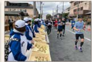
〈京都〉マラソンボランティア