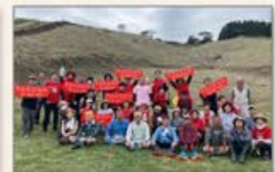
〈熊本〉阿蘇保全活動