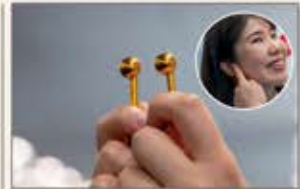
万博史上初 軟骨伝導を活用した聴覚技術を導入