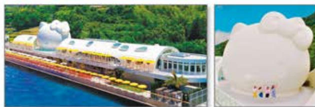
白く巨大なハローキティが目印。人気の観光スポット HELLO KITTY © 2024 SANRIO CO., LTD. APPROVAL NO. L650084