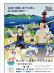
サンポート高松トライアスロン大会ポスター