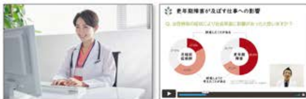
産婦人科専門医による「女性の健康」オンラインセミナーを定期開催