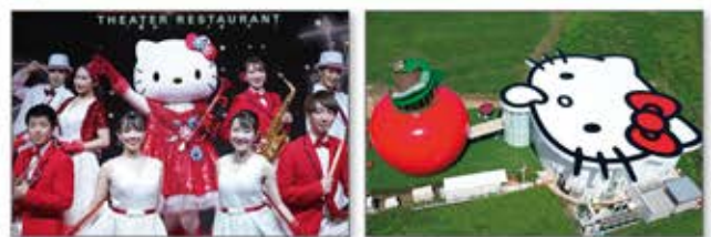
ギネス世界記録™にも認定された世界最大のリンゴのおうち 「HELLO KITTY APPLE HOUSE」を併設 ※ハローキティの衣装は時期によって異なります