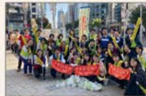
〈東京〉「赤坂青山美しいまちマナーのまち」キャンペーン