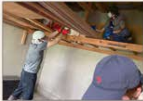
〈秋田〉豪雨災害ボランティア