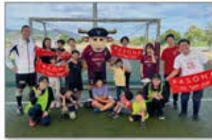
淡路島 親子サッカー教室