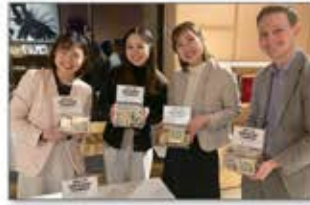
全国 緊急募金活動

東京、淡路島を中心に企業や団体と連携した被災者支援のためのチャリティコンサートを開催。募金活動等を通して被災地の応援に繋げる。