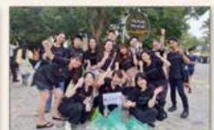
〈シンガポール〉ビーチクリーン