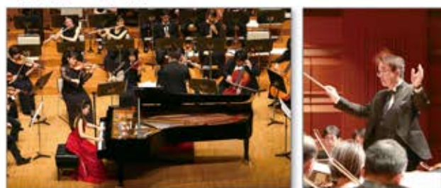
世界中の子供たちへの音楽教育プロジェクトに寄付活動を実施