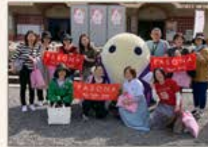
〈京都〉ピンクリボンウォーキングイベント