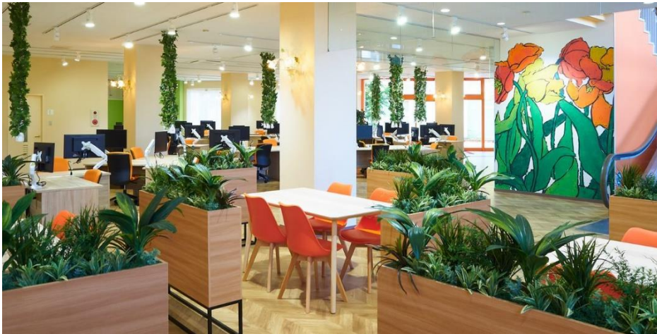
▲緑あふれる働きやすい空間で、多様なデジタル人財を受け入れる DXオペレーションセンター（パソナワーケーションハブ・カリヨン内）

2022年淡路島に開設したグローバルテクノロジーセンター内に新たに「DXオペレーションセンター」を開設。ダナン市など海外からの人財を受け入れながら、高度なデジタル人財を育成するとともに、パソナグループのDXを牽引していく拠点とする。