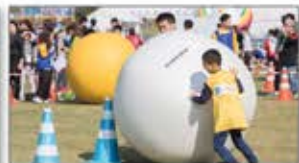
大玉転がしや玉入れなどの競技