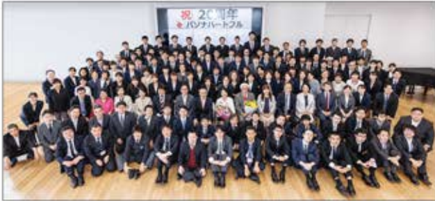
創業20周年のパソナハートフル キックオフミーティングを開催

「障害は個性、才能に障害はない」をコンセプトに、働く意欲がありながら就労が困難な障害のある方々がイキイキと働ける環境と健常者と共に社会参加できる“共生の場”を創りだしてきました。特例子会社パソナハートフルをはじめ、グループ各社で個々の能力を活かして活躍の場を広げています。