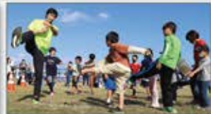
トップアスリートの「走り方教室」