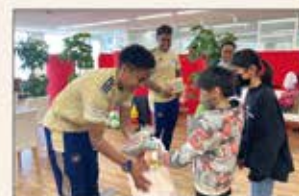
▲名古屋 文具品の寄贈