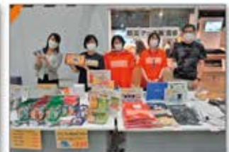
▲防災グッズ販売会