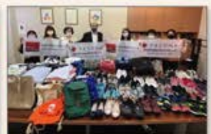
▲台湾 東アフリカ物資支援