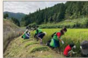
▲滋賀 稲刈りボランティア