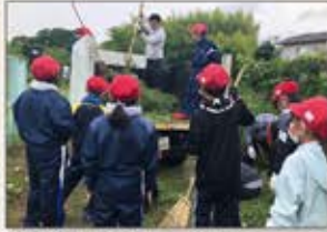
▲淡路島 都家地区草刈りボランティア