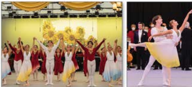
世界的バレリーナ針山愛美氏とウクライナから避難したバレエダンサーらが、世界平和の祈りを込めた特別公演「Souls for Peace」開催

ウクライナをはじめ、世界で活躍するダンサー・講師が集結。本格的なバレエ公演や国際的な講師らによるワークショップ・コンクールも開催。