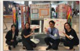
▲広島 G7広島サミット応援企画