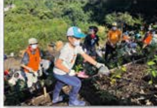
▲高尾小仏 植樹・育樹活動(東京)