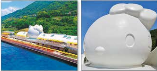
白く巨大なハローキティが目印。人気の観光スポット

海をテーマにしたハローキティの世界をプロジェクションマッピングで体験。食の宝庫淡路島の食材で本格的な中華料理も楽しめる。