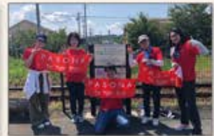
▲浜松 花のリレープロジェクト