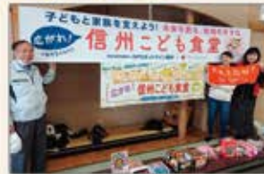
▲長野 子ども食堂ボランティア