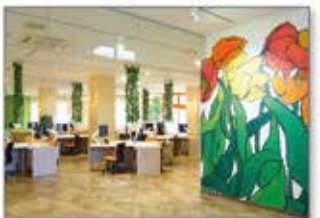
ワーケーションハブ・カリヨン