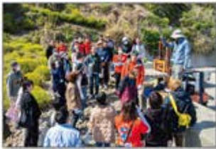
国立淡路青少年交流の家： 次世代向け環境教育プログラムの提供