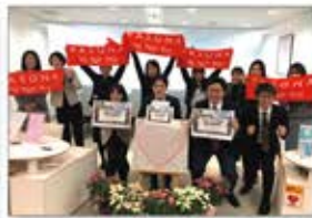
▲全国の各支店で緊急支援募金を実施