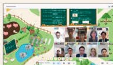
メタバース空間を活用した研修も実施

パソナグループの未来を創造する人材の“種”を育成するプログラム。シャドーキャビネット大学院の受講者からメンバーを選抜し、社会課題に対して問題の背景を探り、解決の糸口を見つけていくワークショップを実施。