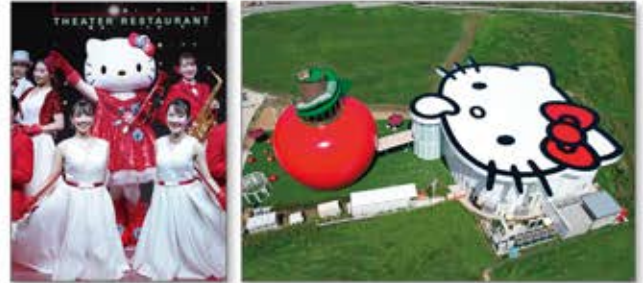
ギネス世界記録™にも認定された世界最大のリンゴのおうち 「HELLO KITTY APPLE HOUSE」を併設

大人から子供まで楽しめる歌・ダンス・演奏によるショーと、身体に優しい美味しいヴィーガン料理・スイーツを提供。