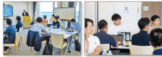
IT基礎からアプリケーション開発まで実践的な研修プログラム