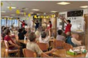
▲東京 デイサービス施設でのよさこいイベント