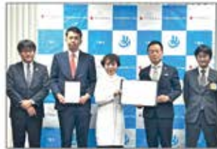
山口県下関市： 総務省の地域活性化起業者制度を活用した派遣協定も締結