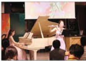
▲チャリティーコンサートを東京・青山で開催

2023年2月、トルコ南東部で発生した大地震により、数十万の建物が損壊、トルコ、シリア両国で甚大な被害を受けました。発災直後から全国各支店や淡路島内の各施設、エキスパートスタッフの方々による緊急支援募金を実施。東京・青山のPASONA SQUAREでは、チャリティーコンサートも開催。被災された方々へ支援金を寄付しました。