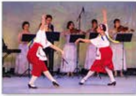
▲ウクライナから避難し、淡路島で活動するバレエダンサー

2022年5月より、ウクライナのバレエダンサー等の日本への避難とバレエ活動の継続を支援。2023年1月には駐日ウクライナ大使が淡路島へ表敬訪問され、バレエダンサーとして活動する様子を視察すると共に、支援への感謝の言葉を頂きました。特別セレモニーでは、ウクライナ舞踊の他、和太鼓に合わせたバレエを披露し、全国の役職員からの募金と、アーティスト社員が描いたウクライナの国花・ひまわりの絵を贈呈しました。