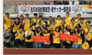
▲東京 知的障害者サッカーボランティア