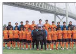
FC.AWJサッカーチームの11名が入社。競技と仕事のハイブリッドキャリアを実践