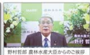
野村百郎 農林水産大臣からのご挨拶