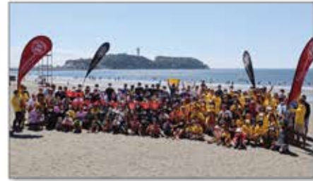
▲江の島ビーチクリーン活動