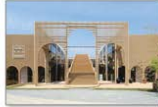
▲グローバル ハブ スクエア

自然災害・パンデミック対応はもとより、地方創生、新産業の創造に向けて、グループ全体のBCPを推進。パソナグループの未来事業構想実現に向けた戦略オフィス、多様な働き方を推進するワーケーションオフィス、BPOセンターを島内で7か所に開設。