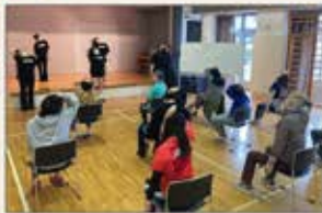
▲東京 障がい者向けダンス教室