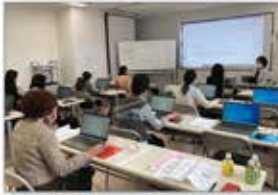
▲キャリア支援講座

ひとり親家庭のコミュニティづくりや絆を深める機会の創出を目的に、親子で楽しむことができる「サッカー教室」や「ダンス教室」などを開催しています。