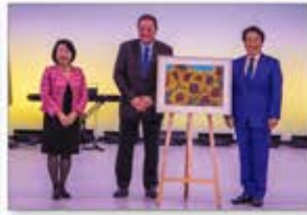
▲ウクライナの国花「ひまわり」の絵画を寄贈