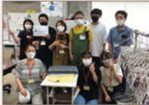
▲熊本 豪雨災害写真洗浄ボランティア