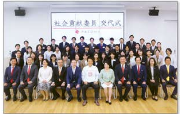
▲社会貢献活動のリーダーとして、全国のグループ各社より40名の社会貢献委員を任命