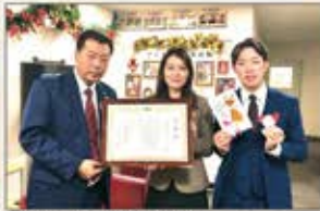
▲福岡 特別養護老人ホームへのクリスマスカード寄贈