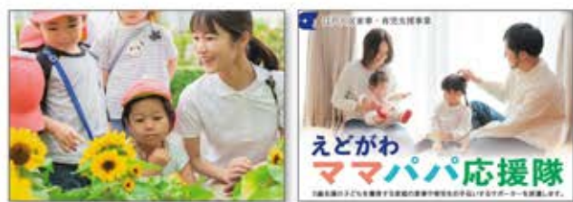
社員・エキスパートスタッフが子育てしながら働ける「パソナファミリー保育園」