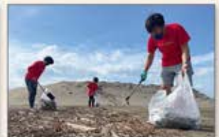
▲新潟 西区海岸清掃活動