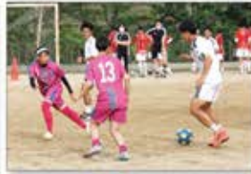
▲元プロサッカー選手による指導