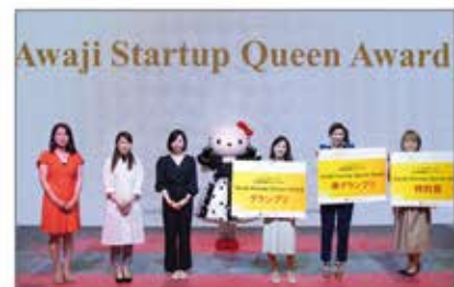
ファイナリスト6名による公開プレゼンテーションにより、グランプリが決定

社会に影響を与える女性起業家・スタートアップを輩出し、一人でも多くの女性の“起業の夢”を支援することを目的に、淡路島を舞台に、事業プランコンテストを実施。