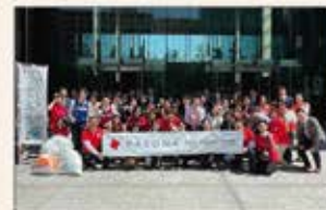
▲東京 青山クリーンアップ活動