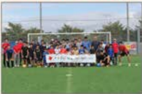
▲つくば ブラインドサッカー教室