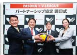
V.leagueとパートナーシップ協定。所属選手のキャリア形成を支援