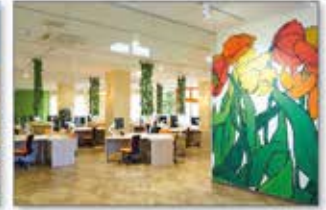
▲ワーケーションハブ カリオン