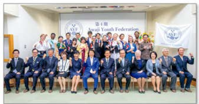
コロナ禍を乗り越え、第4期(2022年6月～2023年4月)を開講