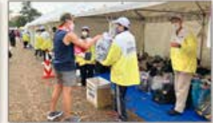
▲岡山 マラソンボランティア