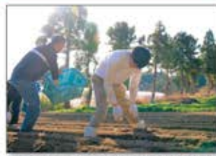
▲テイクアウト用バガス容器を堆肥化し、じゃがいもの苗植えを実施。

サトウキビを原料に作られたバガス容器や淡路島で運営する飲食店舗で廃棄される野菜の切れ端等を堆肥化。島内の施設で腐葉土とともにコンポストにし、オリジナルの堆肥を生産し、野菜栽培に再活用するなど資源循環の仕組みづくりに挑戦。