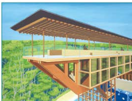
表紙の絵:「淡路島 禅坊靖亭」上田 悟

才能に障害はないをコンセプトに、パソナハートフルで絵を描くことを仕事とする障害のあるアーティスト社員の作品です。迫力ある建物の構図を活かす為に、下書きの際に紙を継ぎ足しながら丁寧に直線を引いています。窓ガラスに反射する景色は、水で薄めた絵の具を頑張って塗り重ねました。