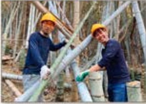
▲静岡 竹林整備活動