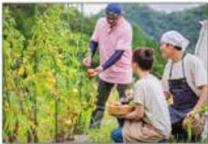
熊本県合志市： 農業の振興など、地域活性化に向けて連携