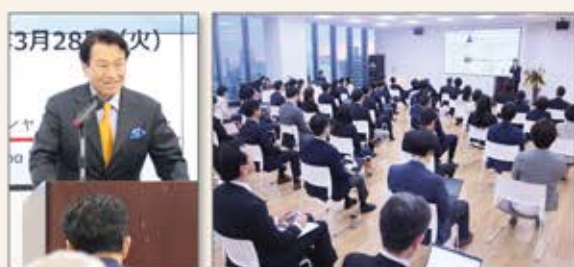
アドバイザーボードからの熱意ある指導のもと、様々な社会提言・事業が誕生