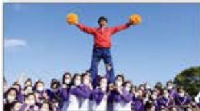
地元の学生がダンスや演奏を披露