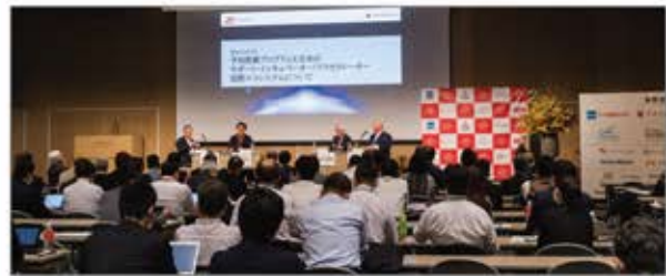
米国スタートアップ企業と国内ヘルスケア関係者の交流会も開催