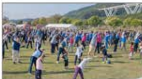
参加者全員で準備体操